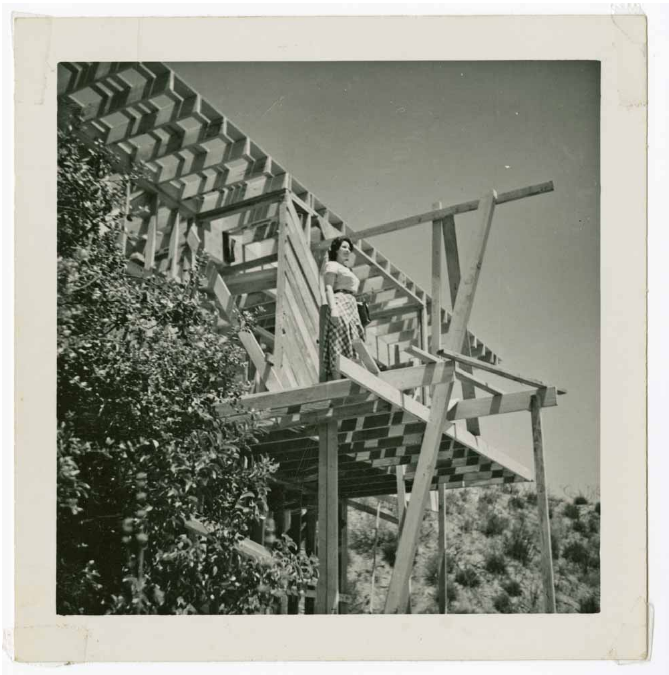
R.M. Schindler, 1949, casa Janson – en construcción.