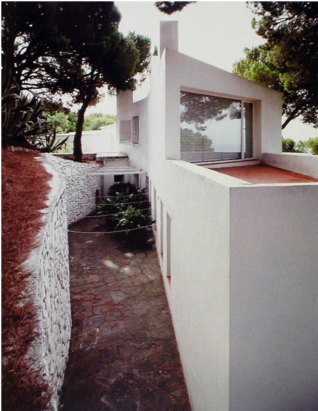
José Antonio Coderch, 1951-53, Casa Ugalde, Fuente de la imagen: http://www.blog.arquitectos.com/blog/arquitectos/casa-ugalde/